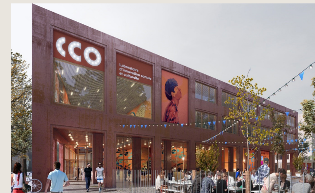
Pendant la journée, un lieu vivant, hospitalier, ouvert, animé, en prise directe avec la vie du quartier

Cette occupation est l'opportunité d'expérimenter une partie des usages de L'Autre Soie et d'inscrire le projet au coeur des dynamiques locales.