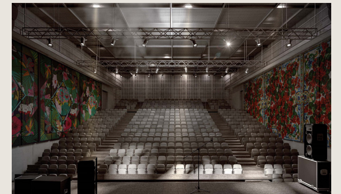
Vue intérieure de la future salle de spectacle de 1.100 places