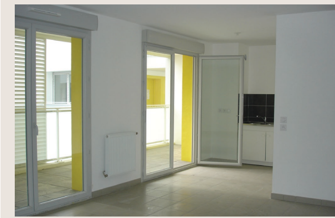
Photo de l'intérieur d'un logement des Jardins d'Eze