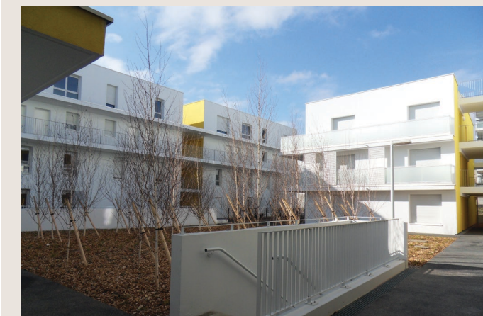
Photo du jardin intérieur des Jardins d'Eze

Le service location de RHONE SAONE HABITAT assure la gestion de 34 logements locatifs sociaux et Alliage Habitat des 40 autres logements.