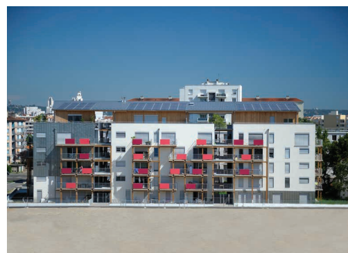
Le Jardin de Jules - Villeurbanne