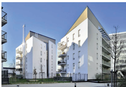
Le Square des Canuts - Vaulx-en-Velin